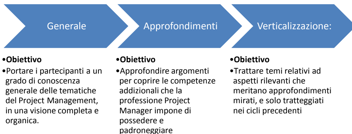
Figura 2: I cicli proposti e loro contenuti

Per favorire la visione organica che il Corso intende fornire, le aree formative e i rispettivi contenuti sono organizzati in Cicli e Sessioni, secondo uno schema composto da tre cicli, ciascuno composto da quattro sessioni di 1,5 giorni.