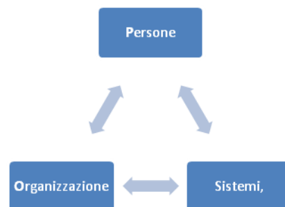
Figura 1: paradigma PSO

Su quest’assunto – applicare le tecnologie del web 2.0 per una più efficace strategia organizzativa – è stato ideato il corso di Alta Formazione in Web Organisation Management, riconoscendo nella loro corretta implementazione un elemento indispensabile per il successo dell’azienda